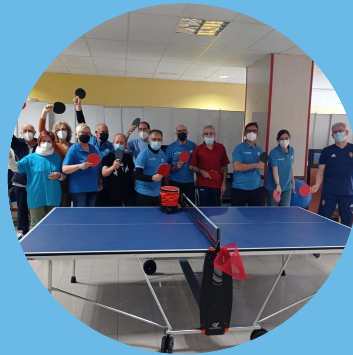
Grupo Voluntarios VI+VE