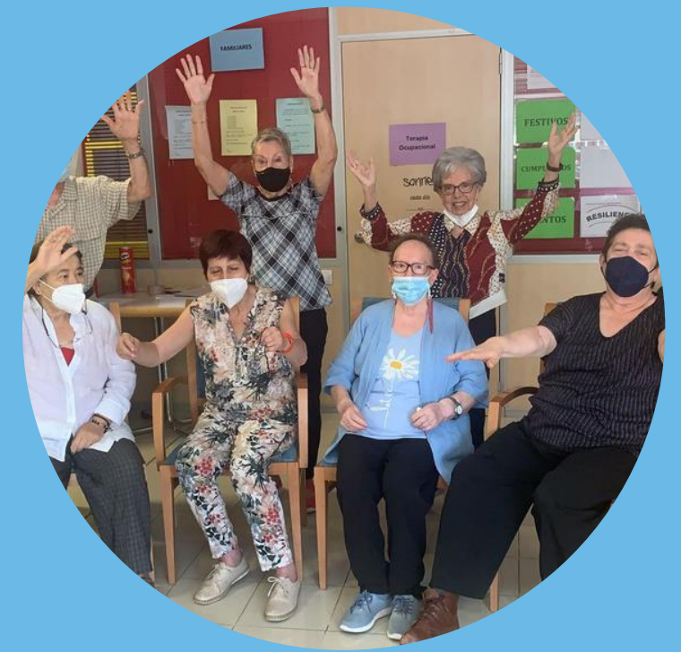
Formación para EP y familiares