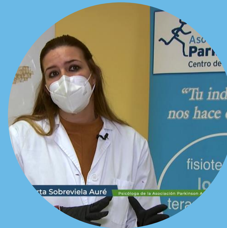
Grupos de ayuda mutua desde Psicología